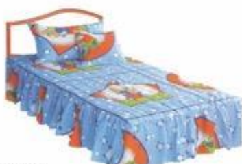
CUBR023 CUBRECAMA INFANTIL ACOLCHADO DISEÑOS SURTIDOS