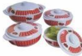
11-133 JUEGO DE 4 BOWL EN MELAMINE