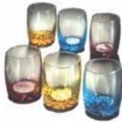
12-212 JUEGO DE 6 VASOS CORTOS