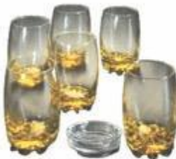
12-215 JUEGO DE 6 VASOS LARGOS