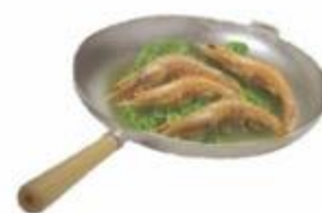
14-S26 SARTÉN DE 26 CM EN ALUMINIO FUNDIDO