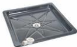
DUCHA002 BASE DUCHA 60x60CM