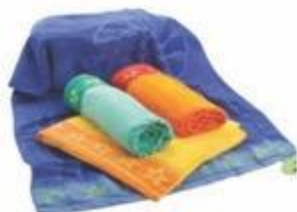
14-237 TOALLA BORDADA 138 CM x 72 CM