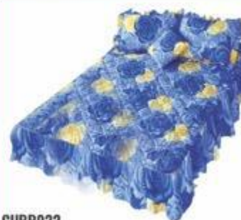
CUBR022 CUBRECAMA INDIVIDUAL ACOLCHADO