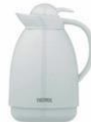
THER007 TERMO PLÁSTICO 2 TAZAS DE 0,5 L VACUUM FLASK