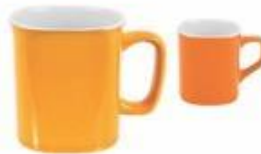
TAZA013 JUEGO DE 6 MUGS DE PORCELANA COLORES SURTIDOS