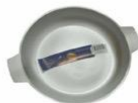
P26ST PAELLERA DE 26 CM SIN TAPA