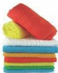
TOAL003 TOALLA SPRING TIME 140 CM x 70 CM