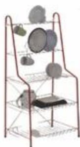
14-287 PLATERA MAX DE 5 NIVELES