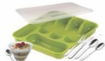
09-113 CUBIERTERA CON TAPA