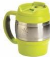
10-140 MINI JARRA INDIVIDUAL CROMADA