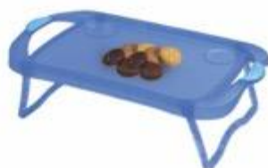
BAND022 MESA DE DESAYUNO PARA CAMA