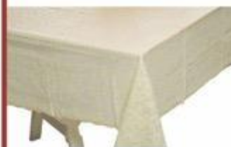
14-194 MANTEL VINIL RECTANGULAR