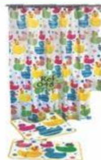
14-202 JUEGO DE CORTINA CON ALFOMBRAS PARA BAÑO