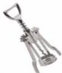
12-142 SACACORCHO CON DESTAPADOR EN ACERO INOXIDABLE