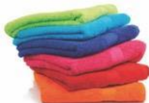
14-240 TOALLA UNICOLOR 450G 100 CM x 50 CM