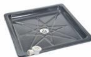
DUCHA003 BASE DUCHA 70x70 CM