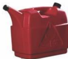
MJA-05G BIDÓN PIMPINA