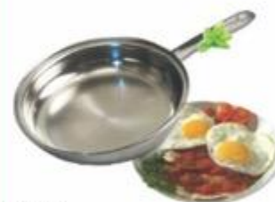
SART015 SARTÉN CON TAPA HELEN WARE TRIPLE LAMINADO ACERO INOX 24 CM