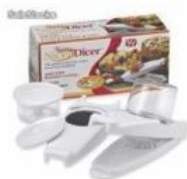
UTEN007 REBANADOR MULTI USO NICER DICER