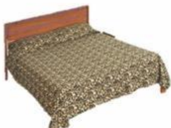
14-214 COBIJA MATRIMONIAL PIEL DE TIGRE