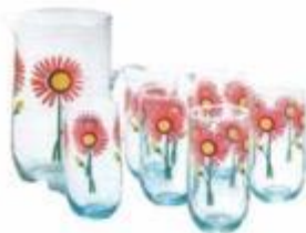
JVAS039 JUEGO DE JARRA CON 6 VASOS FLOR