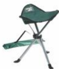
12-280 SILLA TABURETE DE LONA PARA CAMPING DE 3 PATAS