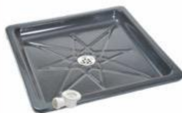
DUCHA004 BASE DUCHA 80x80 CM