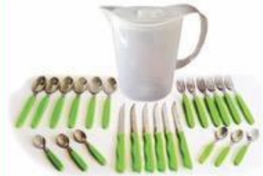
CUBIO24 JUEGO DE CUBIERTOS DE 24 PIEZAS CON JARRA PLÁSTICA MARTINAZZO