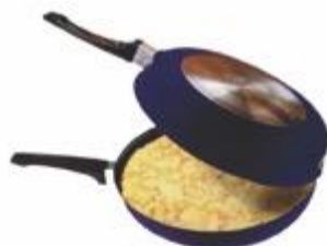
14-016 SARTÉN RIVALTI DOBLE DE 24 CM DE 1 MM