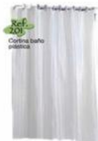
14-201 CORTINA DE BAÑO PLÁSTICA